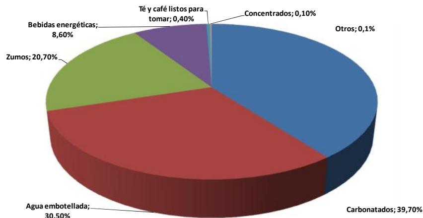
IMAGEN 2. DISTRIBUCIÓN DEL CONSUMO DE REFRESCOS EN EL MERCADO ESPAÑOL SEGÚN EL TIPO DE PRODUCTO